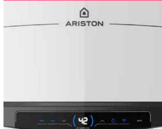
TABLEAU DE COMMANDE INTELLIGENT